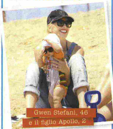
Gwen Stefani, 46 e il figlio Apollo, 2

D urante il Cosmofarma, a Bologna, si è tenuto il Laboratorio di Pediatria, una tavola rotonda di esperti per dare indicazioni alle mamme su svariati temi. Uno degli argomenti trattati è stato il benessere della pelle e la protezione da inquinamento e raggi solari . Durante la conferenza è stato presentato anche il sito losaimamma.it , per un rapido aiuto alle mamme. Il servizio è promosso da La Roche-Posay, Unilever Zendium e Fissan.